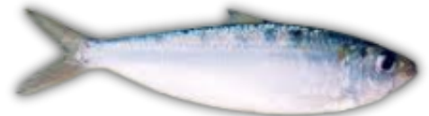
IKAN TEMBANG GOLDSTRIPE SARDINE