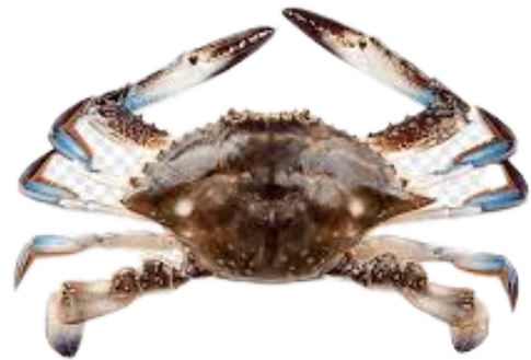
RAJUNGAN BLUE SWIMMING CRAB