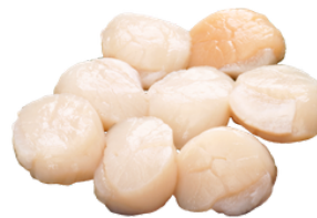
DAGING KERANG SIMPING SCALLOP MEAT