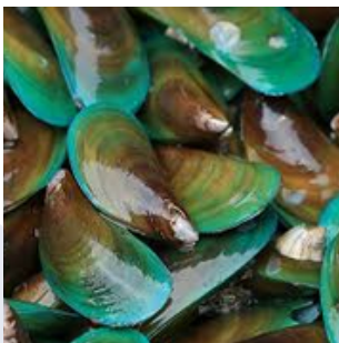
KERANG HIJAU GREEN MUSSEL