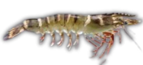
UDANG WINDU TIGER PRAWN

Supported by hygienic handling processes and export-standard cold chain management, we ensure that every shrimp product maintains its natural freshness, vibrant color, and premium quality from harvest to global destination.