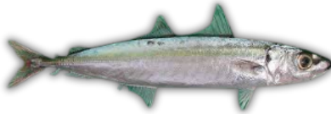
IKAN LAYANG SCAD FISH