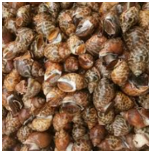
KERANG MACAN BABYLON SHELL

With abundant marine resources, Indonesian shellfish have become an attractive commodity in the global seafood market. Through hygienic handling and controlled storage systems, their freshness and quality are carefully maintained for international distribution.