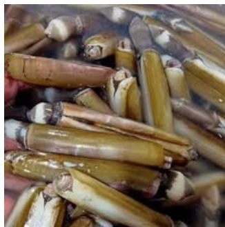
KERANG BAMBU RAZOR CLAM