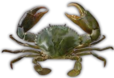
KEPITING BAKAU MUD CRAB

Species such as mud crab are highly favored in international markets, particularly in the hospitality and premium culinary sectors. With careful handling and proper preservation standards, Indonesian crab products are delivered with consistent quality to meet the expectations of global seafood buyers.