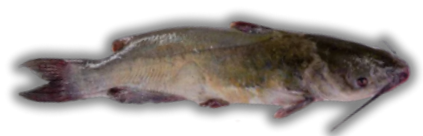
IKAN MANYUNG SEA CATFISH