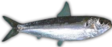
IKAN LEMURU SARDINE FISH