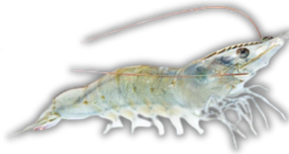
UDANG VANAME WHITELEG SHRIMP