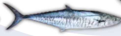
IKAN TENGGIRI SPANISH MACKEREL