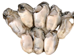
DAGING KERANG TIRAM OYSTER MEAT