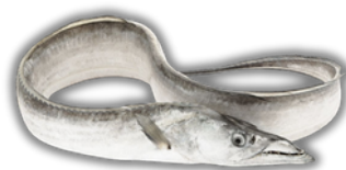
IKAN LAYUR LARGEHEAD HAIRTAIL / RIBBONFISH

*in addition to the products listed in this catalog, we are pleased to accommodate customized seafood requests based on customer needs.