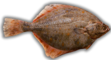
IKAN SEBELAH FLOUNDER / FLATFISH