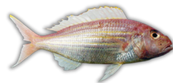
IKAN KURISI THREADFIN BREEM FISH