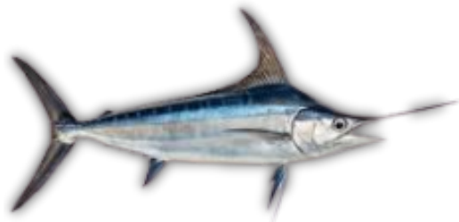
IKAN TODAK SWORDFISH

With rapid onboard handling and export-standard cold chain management, we ensure superior freshness, natural color retention, and premium quality from catch to international destination.