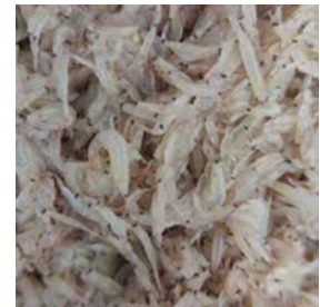
UDANG REBON KRILL / TINY SHRIMP

*in addition to the products listed in this catalog, we are pleased to accommodate customized seafood requests based on customer needs.