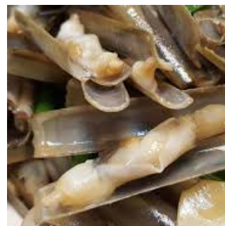
DAGING KERANG BAMBU RAZOR CLAM MEAT