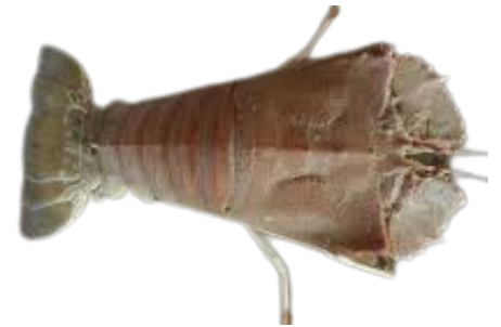
UDANG KIPAS SLIPPER LOBSTER