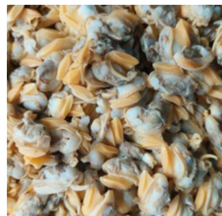
DAGING KERANG BATIK BATIK CLAM MEAT