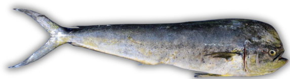
IKAN LEMADANG MAHI-MAHI