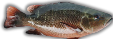
IKAN KAKAP SNAPPER FISH