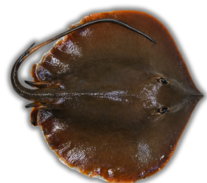
IKAN PARI STINGRAY FISH