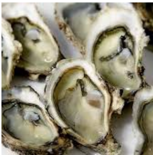
KERANG TIRAM OYSTER