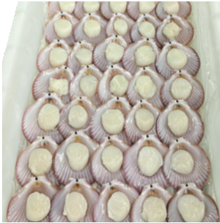
KERANG SIMPING SCALLOP

With abundant marine resources, Indonesian shellfish have become an attractive commodity in the global seafood market. Through hygienic handling and controlled storage systems, their freshness and quality are carefully maintained for international distribution.