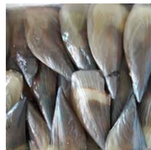
KERANG KAMPAK PEN SHELL