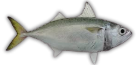
IKAN SELAR YELLOWTAIL SCAD