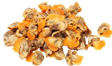
DAGING KERANG DARAH BLOOD CLAM MEAT