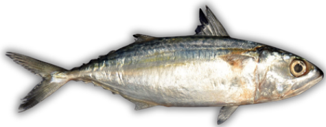
IKAN KEMBUNG MACKEREL FISH

With rapid onboard handling and export-standard cold chain management, we ensure superior freshness, natural color retention, and premium quality from catch to international destination.