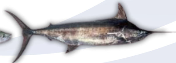
IKAN MARLIN MARLIN