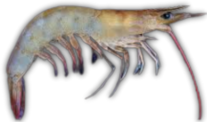
UDANG DOGOL ENDEAVOUR PRAWN