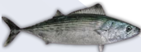
IKAN TONGKOL MACKEREL TUNA