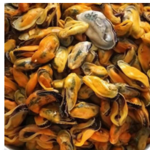
DAGING KERANG HIJAU GREEN MUSSEL MEAT