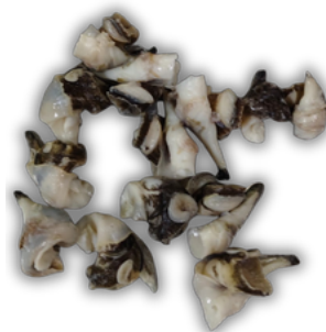
KERANG TEROMPET TRITON'S TRUMPET

*in addition to the products listed in this catalog, we are pleased to accommodate customized seafood requests based on customer needs.