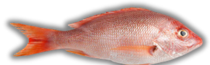
IKAN KAKAP MERAH RED SNAPPER FISH