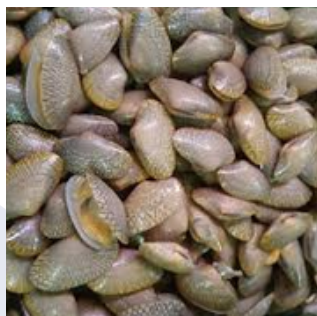
KERANG BATIK BATIK CLAM