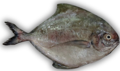
IKAN BAWAL HITAM / DORANG BLACK POMFRET FISH