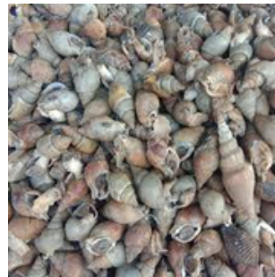
KERANG SUMPIL MINIATURE AWLSNAIL