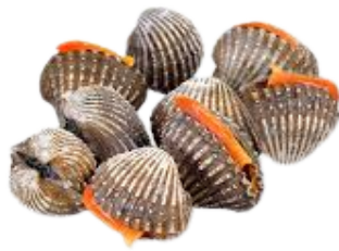
KERANG DARAH BLOOD CLAM

With abundant marine resources, Indonesian shellfish have become an attractive commodity in the global seafood market. Through hygienic handling and controlled storage systems, their freshness and quality are carefully maintained for international distribution.