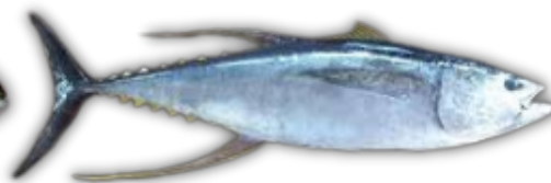
IKAN TUNA SIRIP KUNING YELLOWFIN TUNA