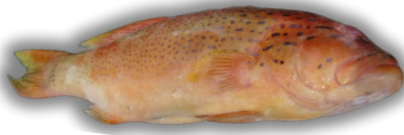
IKAN KERAPU / LODY GROUPE FISH

Supported by hygienic handling processes and export-standard cold chain systems, we ensure optimal freshness, safety, and quality from harvest to global destination.