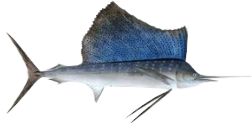
IKAN LAYARAN SAILFISH