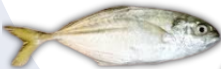
IKAN BENTONG BIGEYE SCAD FISH