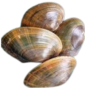
KERANG SAWAH FRESHWATER CLAM